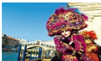
Carnevale di Venezia