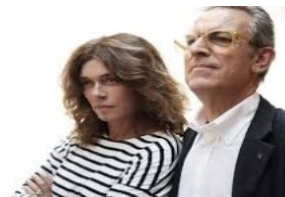
Teatro Ambra Jovinelli

Sul sito Cralteventi.it è possibile prenotare online gli eventi :